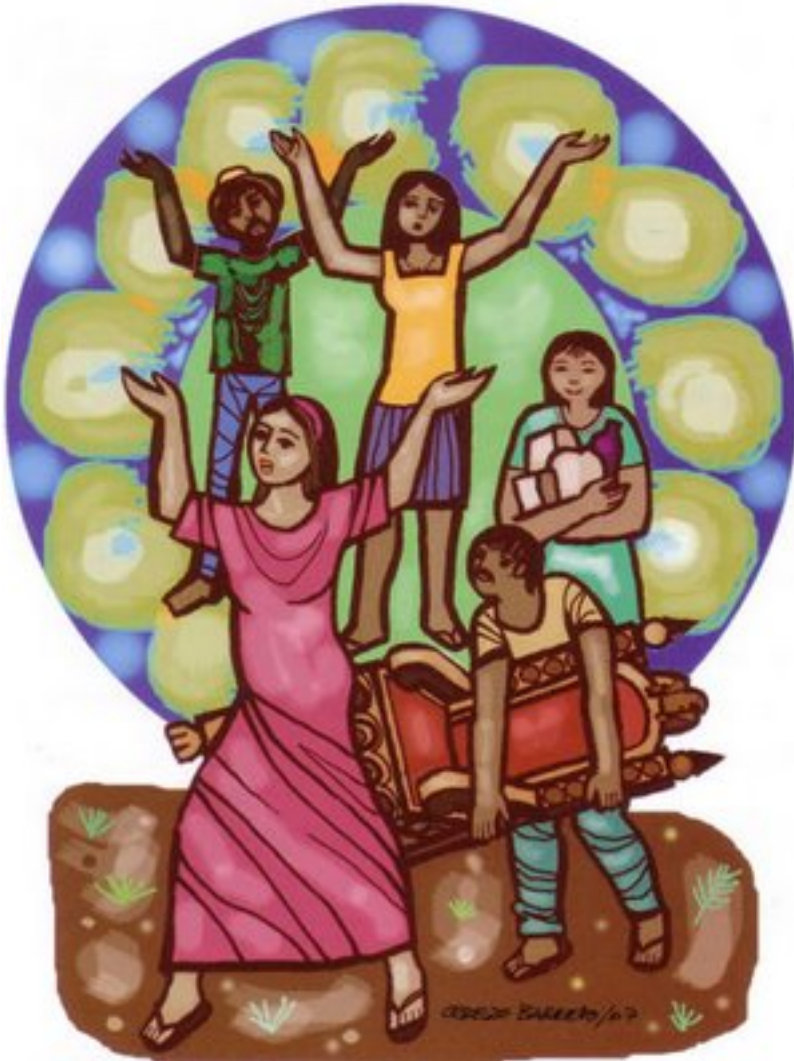
Verónica y su grupo

¿A qué hora se celebró el nacimiento de Jesús? ¿Dónde nació? ¿Cómo se celebró?