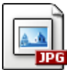
Imagen en alta calidad (919,0 Kb)