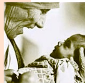
Madre Teresa de Calcuta

Jauna, gose naizenean, emadazu janaria behar duen norbait; Egarri naizenean, emadazu ura behar duen norbait; Hotz naizenean, emadazu beroa behar duen norbait; Sufritzen dudanean, emadazu kontsolamendua behar duen norbait; Nire gurutzea astuna iruditzen zaidanean, utzidazu besteren gurutzea konpartitzen; Pobretasunean banago, jarri nire ondoan behartsu bat; Astirik ez dudanean, emadazu nire minutuak behar dituen norbait; Umiliatua banaiz, emadazu aukera norbait goraiatzeko; Animorik gabe banago, emadazu norbait animo berriak emateko; Besteek ni ulertzea nahi dudanean, emadazu nire ulermena behar duen norbait; Zain nazaten beharrezko zaidanean, emadazu norbait nik zaintzeko; Nigan pentsatzen dudanean, zuzendu nire arreta beste pertsona batengana; Zure laguntzarekin izan gaitezen duinak, Jauna, gure anai-arrebak zerbitzatzeko; Emaiezu, gure eskuen bitartez, ez soilik eguneroko ogia, baizik eta gure maitasun errukiorra, zurearen irudia dena.