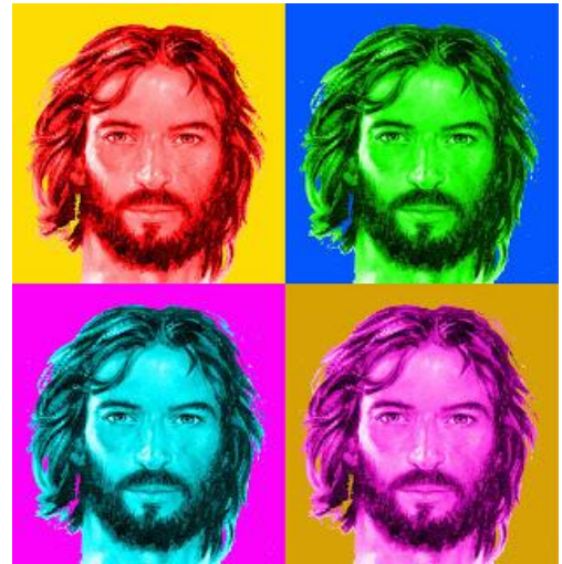
Amanece: Dios pronuncia mi nombre.

Señor, hoy tu nombre es más que una palabra. Es tu voz que hoy resuena en mi interior y me habla en el silencio. ¿Qué quieres que haga por Ti?