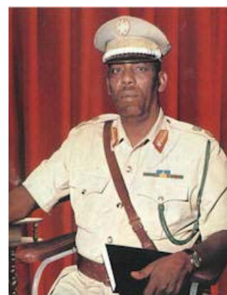
Mohamed Siad Barre

Desde la caída del dictador Barré, el valor de la deuda externa de Somalia no se ha incrementado demasiado. Así, durante el período 1990 – 2006, la deuda ha pasado de 1.362 a 2.152 millones de euros, ya que la comunidad internacional no mantiene relaciones financieras con el Estado somalí fallido. Así, el aumento de la deuda externa somalí se debe principalmente a intereses por impagos que se acumulan a la deuda pendiente (incluyendo principal e intereses del crédito). Así, desde que en 1990 Somalia pagara 6 millones de euros en concepto de servicio de la deuda, no ha vuelto a hacer frente al pago de su deuda externa. Actualmente la deuda externa de Somalia supone unos 255 € / cápita y se estima que significa más del 300% en relación a su PIB.