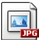
Imagen alta definición para descargar

El artista, allá por 1895, describía la miseria recogida en el cuadro: